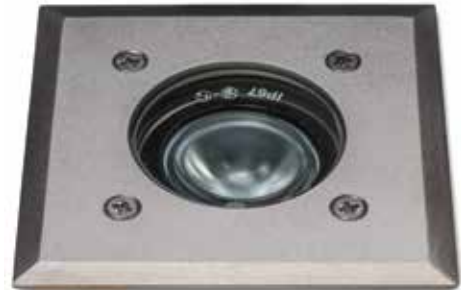
20° - 40°